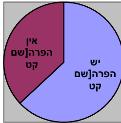
תרשים 1: התפלגות באחוזים של התשובות להפרת סודיות או לאי-הפרה במחקר של לוזובסקי

בלוח 3 מוצגים התפלגות התשובות לשאלות בדבר הפרה או אי-הפרה ע"פ המשיבים בכך ולא בכל אחד מהמקרים, לפי המחקר שלנו.