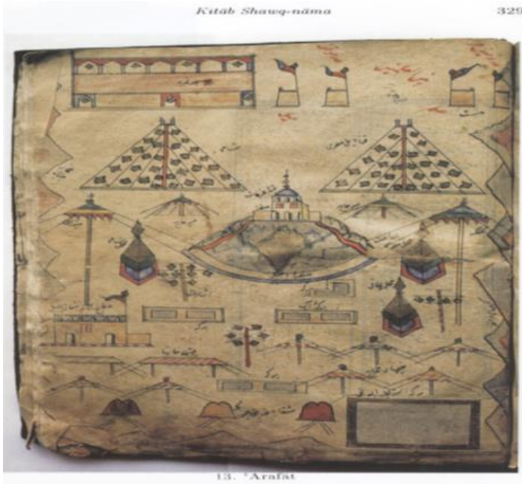
قهوه خانة - مَكَّة (1563) (1)

ويمكن أن نلاحظ توافقًا في الروايات بين المصادر حول طريقة انتشار القهوة من اليمن نحو شمال الجزيرة العربية ثم إلى مصر وسوريًا (بلاد الشام). وتجزم المصادر أنّ رجال الدين هم الذين بدأوا في استخدام القهوة كمشروب، وخاصّة بين رجال الصوفيّة ومشايخها. فيذكر الجزيرة، أحد علماء القرن السادس عشر في مصر، أنّ القهوة استخدمت مبكرًا وارتبط استعمالها برجال الدين والصدّيقين ومشايخ الصوفيّة في اليمن، ومنهم الشّيخ جمال الدين